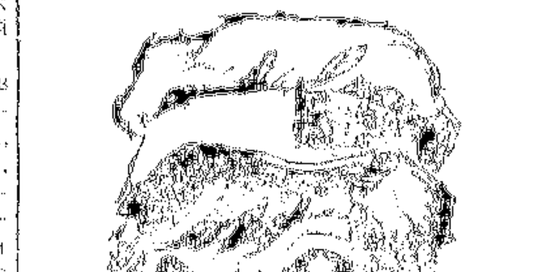
ис. в. ностомолочного